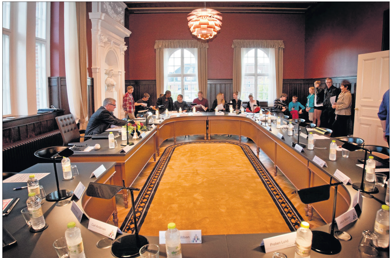
Skal der transmitteres direkte fra byrådsmøderne i Sorø, så borgerne kan se optagelser hjemme fra stuerne? Det skal politikerne debattere i de kommende måneder.

- Mange føler med rette, at det politiske liv er flyttet længere væk, især i forbindelse med kommunesammenlægningen. Transmittering fra byrådsmøderne kan være med til at skabe